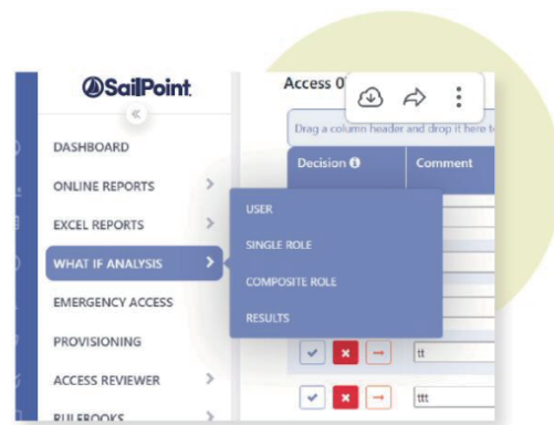
在佈建之前模擬風險